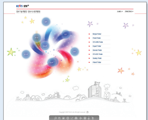
▲ KISTI-STA® 메인화면